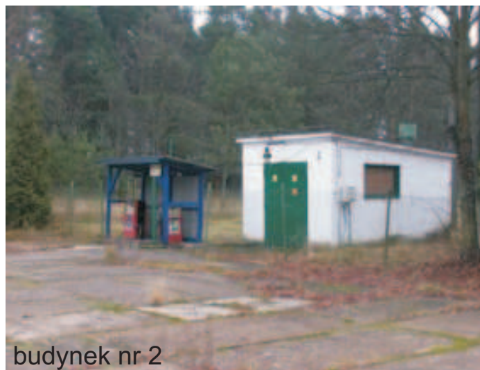
budynek nr 2