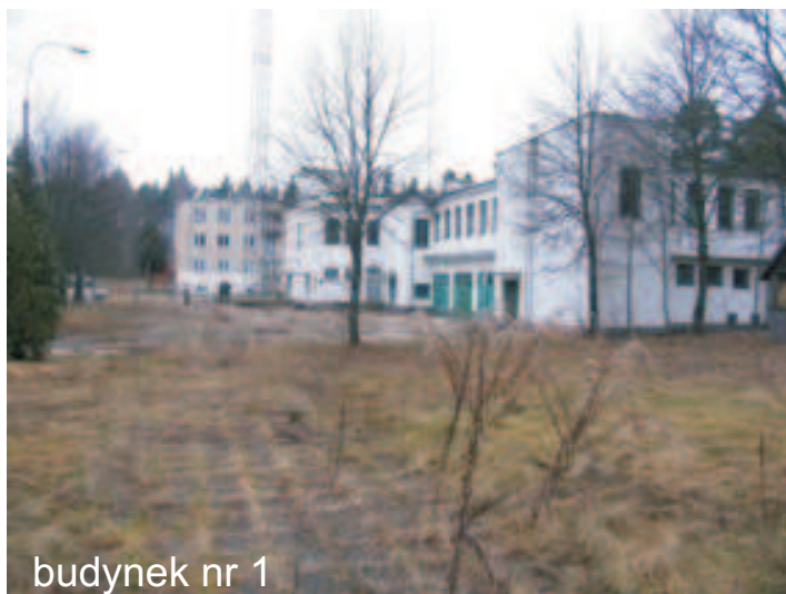
budynek nr 1