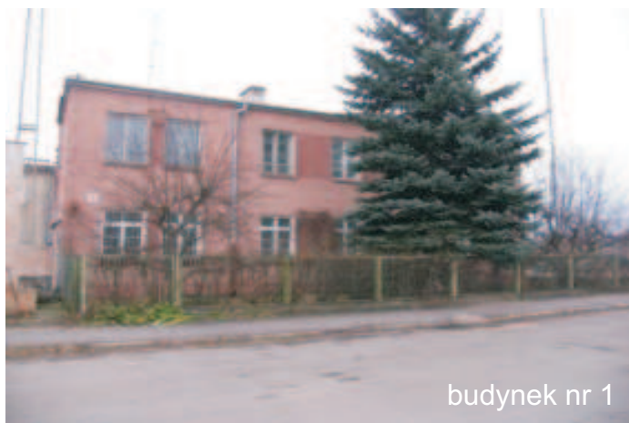
budynek nr 1