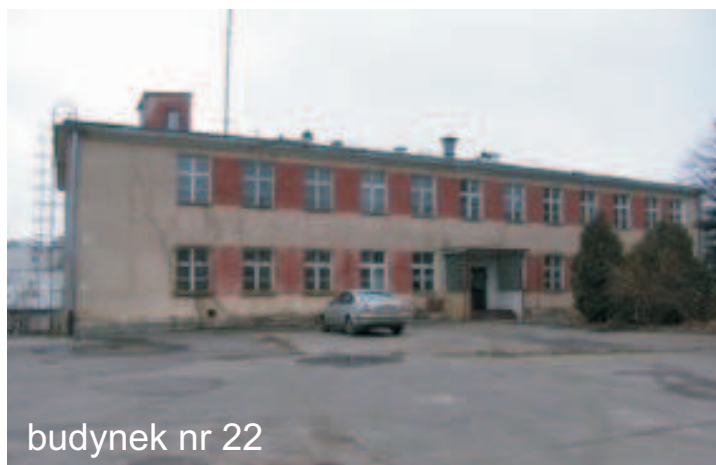
budynek nr 22

Nieruchomość to trzy działki gruntu o łącznej powierzchni 0,5543 ha. Działka nr 788/5 o powierzchni 0,0680 ha jest niezabudowana. Budynek nr 1 o powierzchni użytkowej 405 m 2 wybudowany został w 1936 roku. Posadowiony jest na działce 788/3 o powierzchni 0,0517 ha. Działka nr 788/4 o powierzchni 0,4346 ha zabudowana jest budynkiem nr 22 o powierzchni użytkowej 885 m 2 , wybudowanym w 1953 roku. W budynku tym znajduje się węzeł ciepły dwufunkcyjny na potrzeby c.o. i c.w. o mocy 1009 kW, zmodernizowany w 1998 roku. Na działce urządzone jest również boisko do piłki siatkowej, plac o nawierzchni bitumicznej służący jako parking oraz myjka samochodowa.