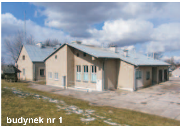
budynek nr 1