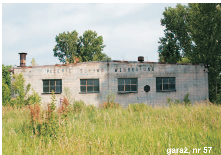
garaż, nr 57