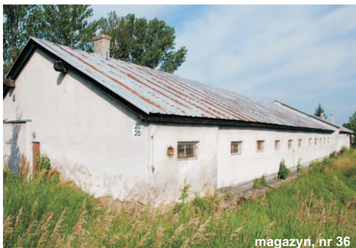
magazyn, nr 36