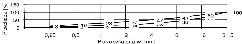
Krzywa uziarnienia kruszyw 0 - 31.5 mm